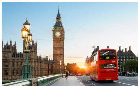
Trendspaning i LONDON. Datum ej fastställt.