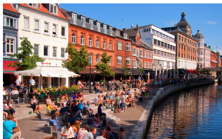
“Explore the world with Aarhus” 2 - 3 juni i samarbete med Aarhus Cityforening