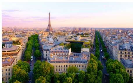
PARIS i samband med mässan Maison & Objet 8-12 september