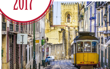
LISSABON 28 april - 1 maj med Magnus Palmqvist & Malin Olsson